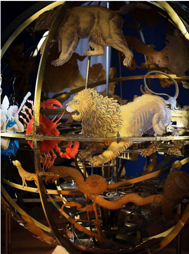
Udsnit: Stjernetegn – Tvillingerne, Krebsen, Løven – på ydersiden af Den Gottorpske Himmelglobus.